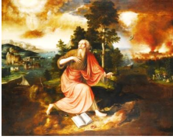
Jan Massijs: The Apocalypse of Saint John

Jeweils mittwochs, einmal pro Monat um 19.30 Uhr im Schlössli Schafisheim. (Anmeldung nicht nötig)